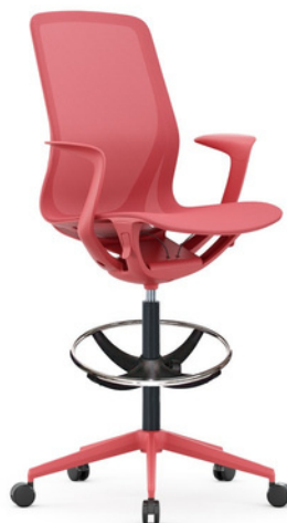
OHE-503 Coral KitCajero