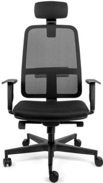
OHE-23Negro + cabecera