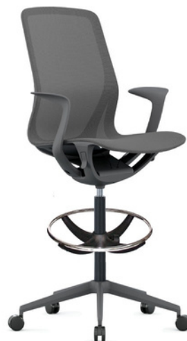
OHE-503 Gris KitCajero