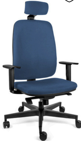
OHE-25Negro + cabecera