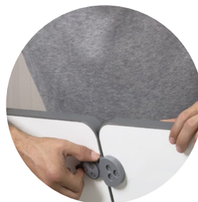
Conectores para unir las mesas.